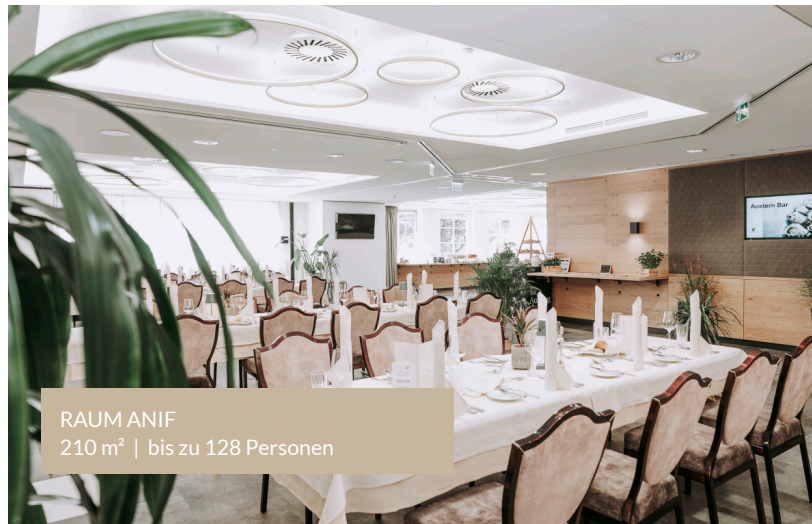
RAUM ANIF 210 m 2 | bis zu 128 Personen

Es stehen verschiedene Räume zur Verfügung, die an Ihre Bedürfnisse und Wünsche angepasst werden können.