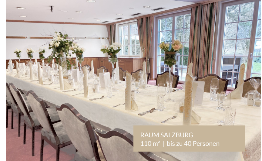
RAUM SALZBURG 110 m 2 | bis zu 40 Personen

Der Hubertushof bietet den perfekten Rahmen für Ihre individuelle Veranstaltung. Die Bestuhlung im Innen- und Außenbereich richtet sich ganz nach Ihren Bedürfnissen: Stehtische beim Flying Buffet, eine große Tafel mit Ihren Lieblingsmenschen beim klassischen Dinner oder eine Geburtstagsfeier mit Speisenwahl vom Buffet.