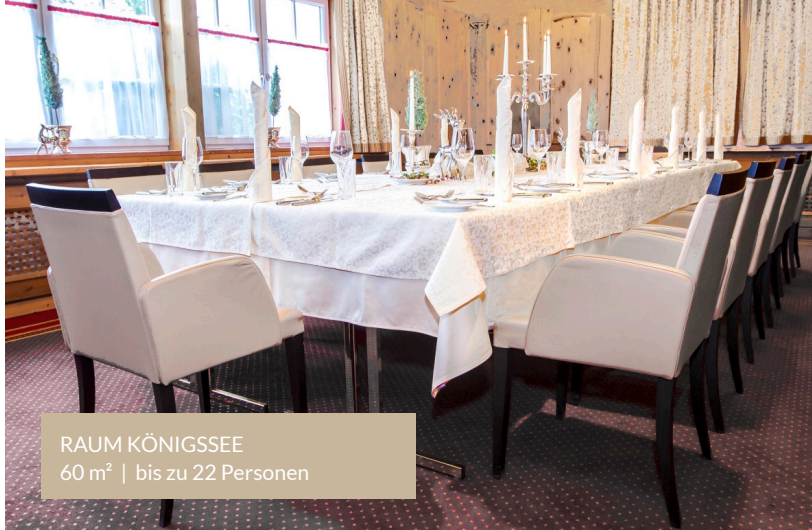
RAUM KÖNIGSSEE 60 m 2 | bis zu 22 Personen