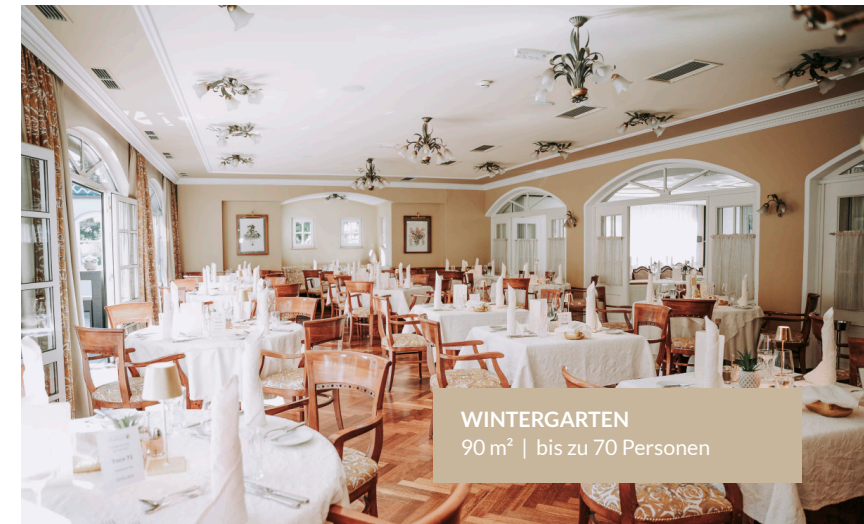
WINTERGARTEN 90 m 2 | bis zu 70 Personen